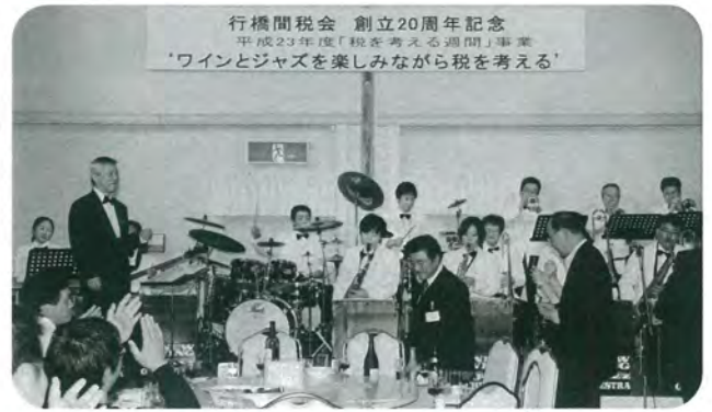
平成23年11月 行橋間税会 創立20周年記念事業の様子