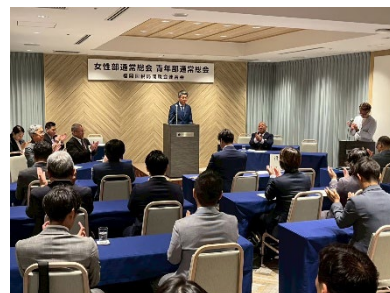
第32回青年部通常総会