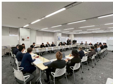
役員会議と意見交換会