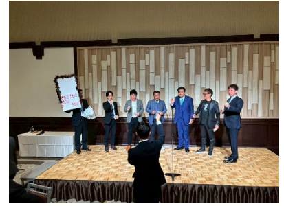
福岡国税局間税会連合会青年部研修会in小倉