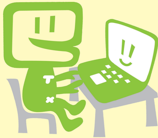
国税庁 e-Tax キャラクター イータ君